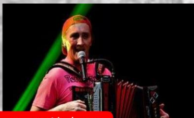
Ronnyron Limburgs Loestige Lalamaker