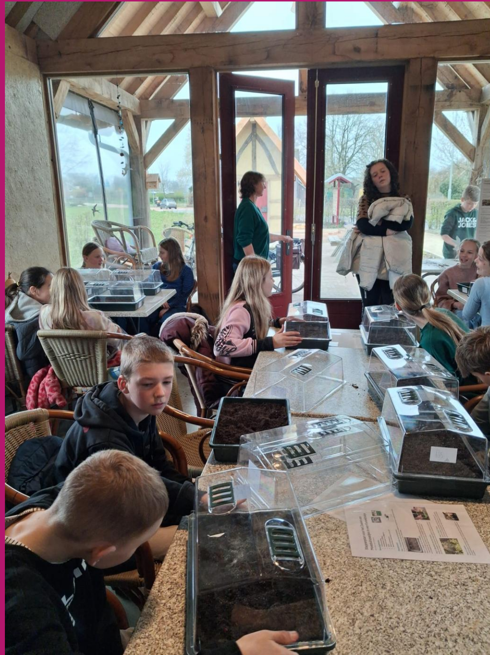
Burger Initiatief Gemout