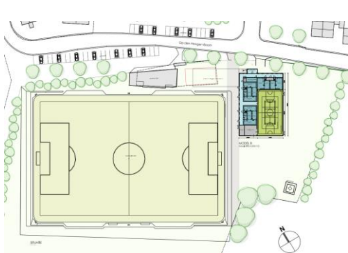
Figuur 1 minimale variant sportzaal

De werkgroep Sportaccommodatie van de Coöperatie BurgerInitiatief Genhout heeft door Architecten Bureau Wehrung schetsen voor zo'n sportzaal naast het Jean Nijsten Sportpak laten opstellen: een minimale en een optimale variant.