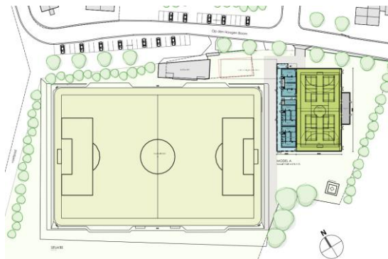
figuur 3 optimale variant

De investering voor de minimale variant is indicatief geraamd op € 1,7 mln en de optimale op € 3,0 mln. De raming is van 1,5 jaar geleden.